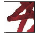
Coupe croisée 4x40 mm Niveau de sécurité DIN 3 Documents confidentiels.